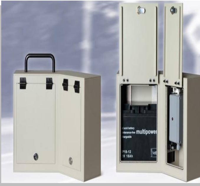
Licznik ruchu drogowego Viacount II