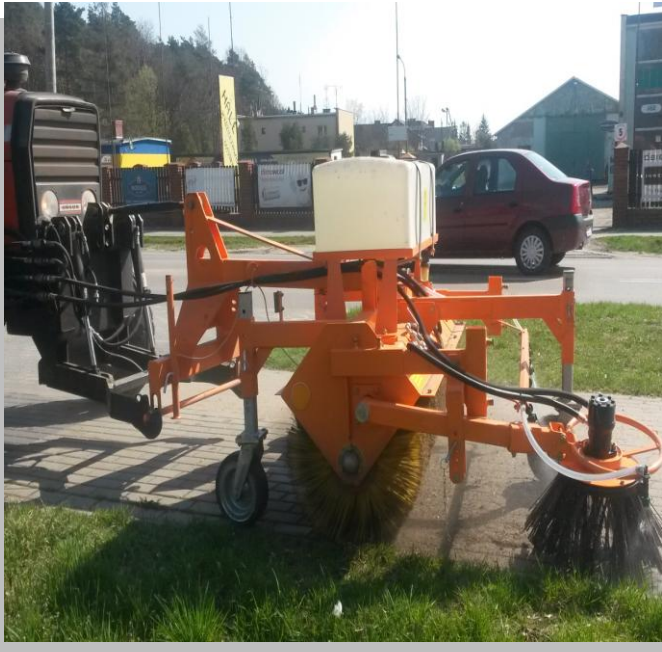
Zmiatarka komunalna POM Augustów T801 rok produkcji 2017